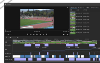
AI自動化ソリューション